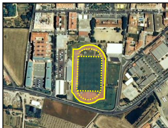
Ejemplo de Pista deportiva .